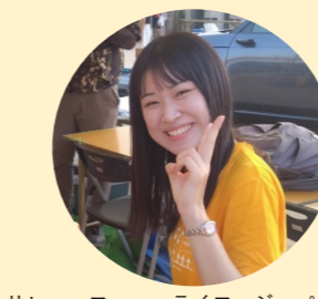
リレー・フォー・ライフ・ジャパン2024 滋賀医科大学 実行委員長

「リレー・フォー・ライフ・ジャパン2024滋賀医科大学」の成功を心から祈念申し上げるとともに、学生たちがこの経験を活かして、未来の医療を担う素晴らしい医療人に成長されることを期待しております。