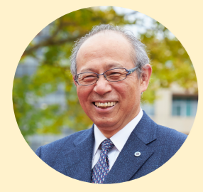
国立大学法人滋賀医科大学長